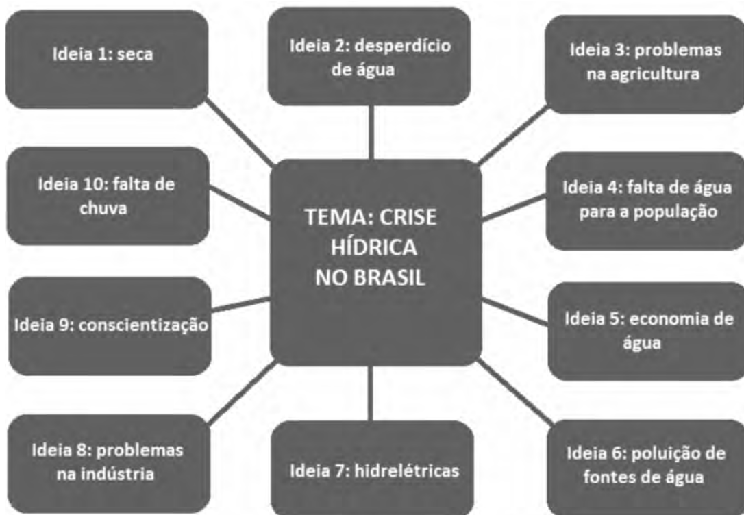
Diagrama de tempestade de ideias

OBS: O diagrama de tempestade de ideias não é um modelo estático ou padrão.